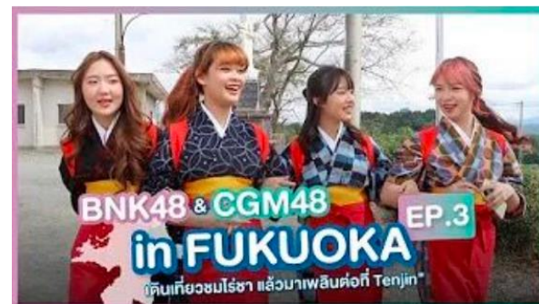
（令和4年度選抜メンバーによるPR動画）

・7月にタイのアイドルグループ「BNK48・CGM48」の選抜メンバーを招請し、観光PR動画を撮影（youtube・TikTok等に掲載予定）